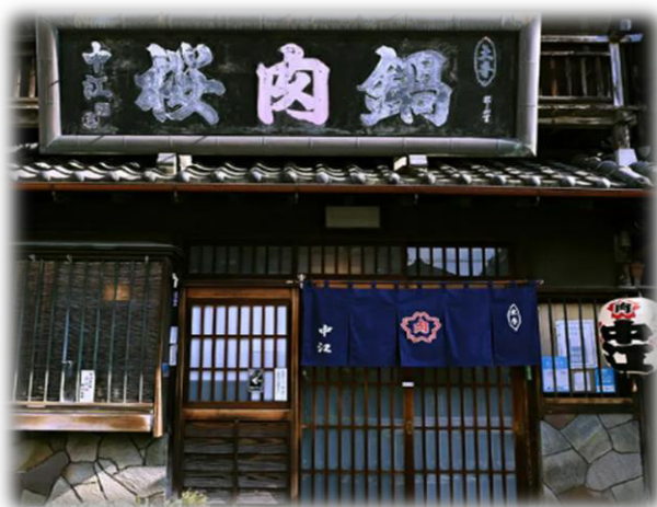
<桜なべ中江> 懇親会場