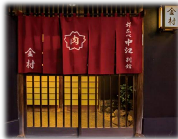
<桜なべ中江別館金村> 講演会場