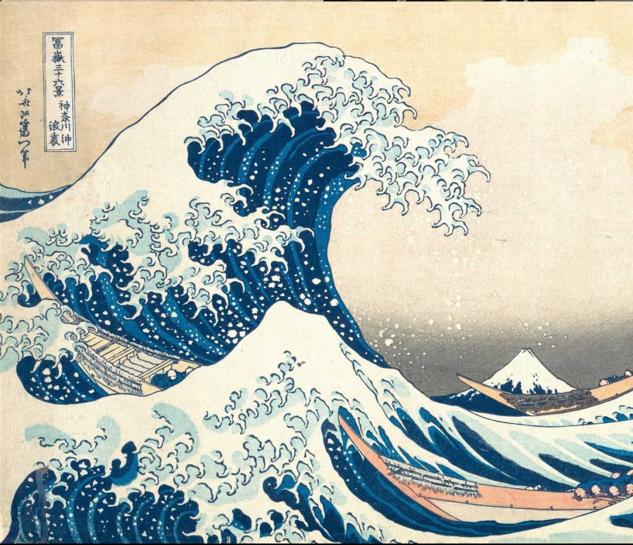
富嶽三十六景 神奈川 浪裏 葛飾北斎