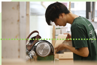
カンディハウス社